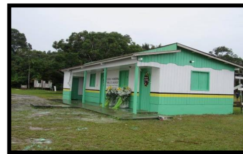
ESCOLA MUNICIPAL ORNELLES LAVAREDA REGIÃO: MASSAUARI – ZONA RURAL ANO: 2019 – REFORMA E AMPLIAÇÃO