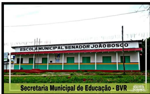
ESCOLA MUNICIPAL SENADOR JOÃO BOSCO REGIÃO: MASSAUARI – ZONA RURAL ANO: 2019 – REFORMA E AMPLIAÇÃO Secretaria Municipal de Educação - BVR