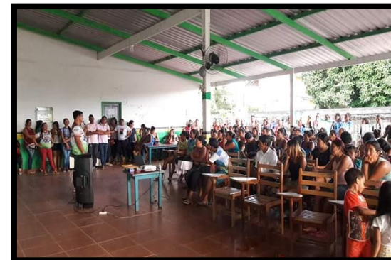
CRIAÇÃO E CAPACITAÇÃO DOS CONSELHOS ESCOLARES ANO: 2018