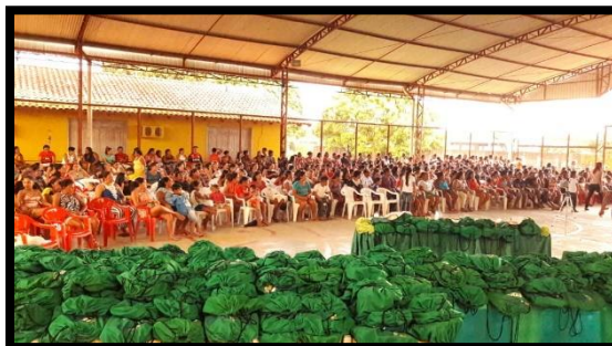
DISTRIBUIÇÃO DE KITES E FARDAMENTO ESCOLAR ANO: 2018