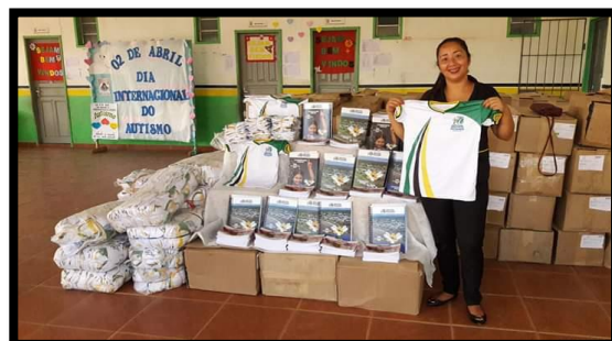
DISTRIBUIÇÃO DE KITES E FARDAMENTO ESCOLAR ANO: 2018