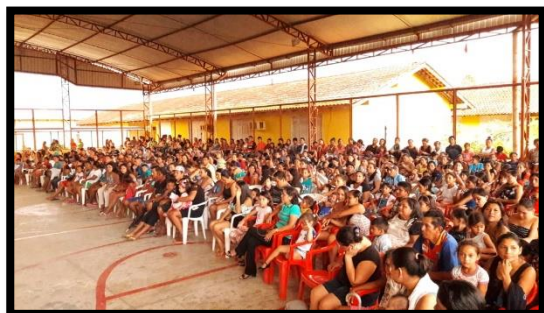
DISTRIBUIÇÃO DE KITES E FARDAMENTO ESCOLAR ANO: 2018