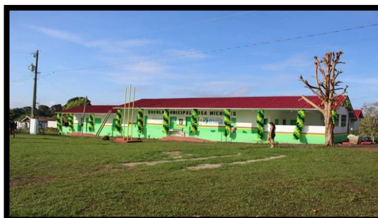
ESCOLA MUNICIPAL ROSA MICHILES REGIÃO: LAGO PRETO – ZONA RURAL ANO: 2019 – REFORMA E AMPLIAÇÃO