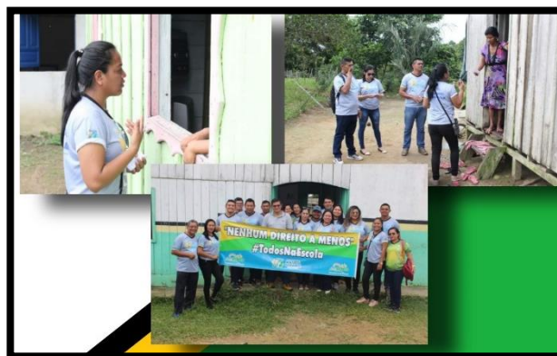
MULTIRÃO DE MATRÍCULAS ANO: 2019