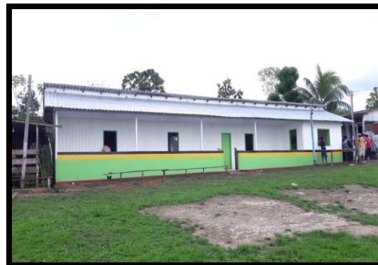
ESCOLA MUNICIPAL SOCORRO PEREIRA I REGIÃO: RAMOS DE CIMA – ZONA RURAL ANO: 2018 – REFORMA E AMPLIAÇÃO