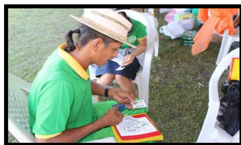
MONITORAMENTO PEDAGÓGICO ANO: 2019