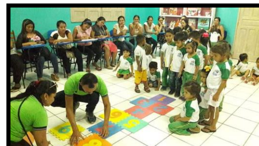
MONITORAMENTO PEDAGÓGICO ANO: 2019