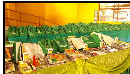
DISTRIBUIÇÃO DE KITES E FARDAMENTO ESCOLAR ANO: 2018