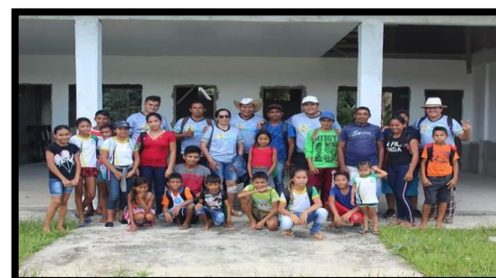
MONITORAMENTO PEDAGÓGICO ANO: 2019