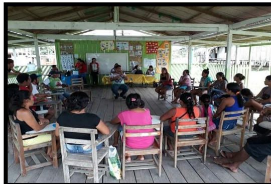
CRIAÇÃO E CAPACITAÇÃO DOS CONSELHOS ESCOLARES ANO: 2018