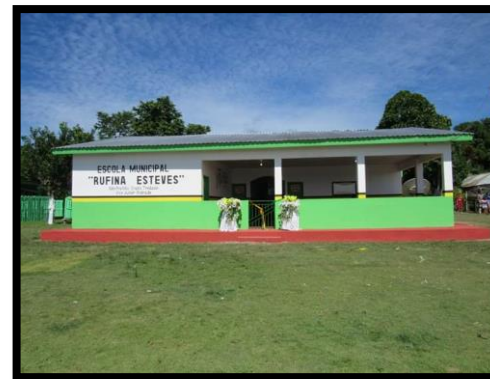
ESCOLA MUNICIPAL RUFINA ESTEVES REGIÃO: LAGO PRETO – ZONA RURAL ANO: 2019 – REFORMA E AMPLIAÇÃO