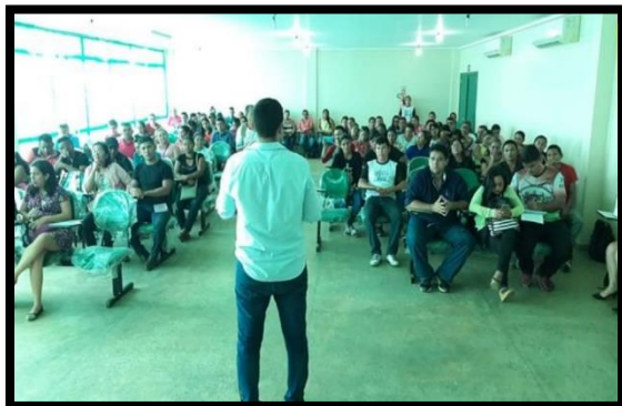
CRIAÇÃO E CAPACITAÇÃO DOS CONSELHOS ESCOLARES ANO: 2018