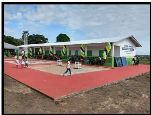
ESCOLA MUNICIPAL AUGUSTO TEIXEIRA REGIÃO: RAMOS DE BAIXO E LAGOS – ZONA RURAL ANO: 2018 – REFORMA E AMPLIAÇÃO