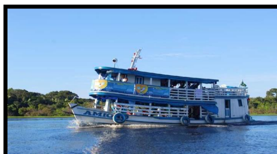
MONITORAMENTO PEDAGÓGICO ANO: 2019